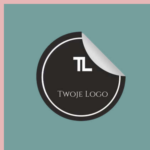
Naklejki logo na produktach