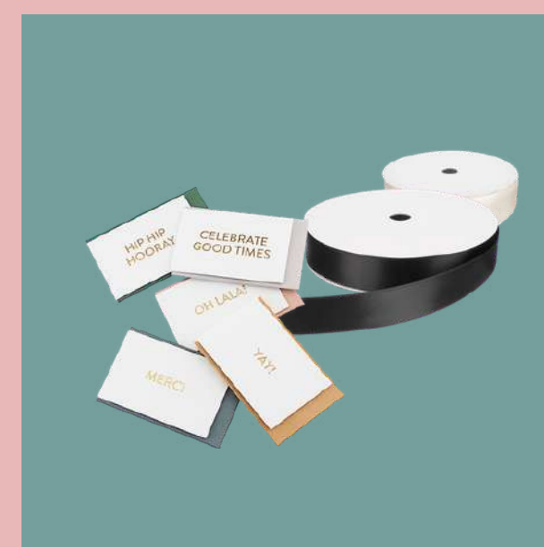
Wstążki z bilecikiem