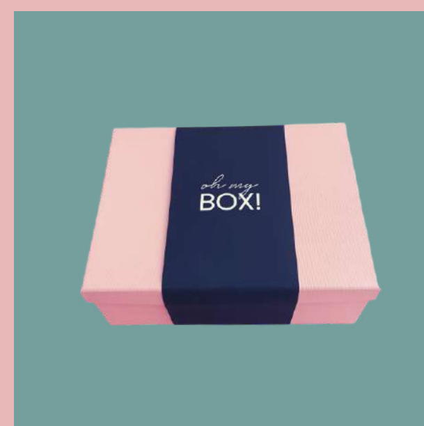
Banderola z logo na pudełku