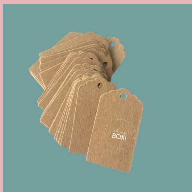
Zawieszki na produktach kolorowe lub kraftowe

W cenie zamówienia proponujemy elementy personalizacji: