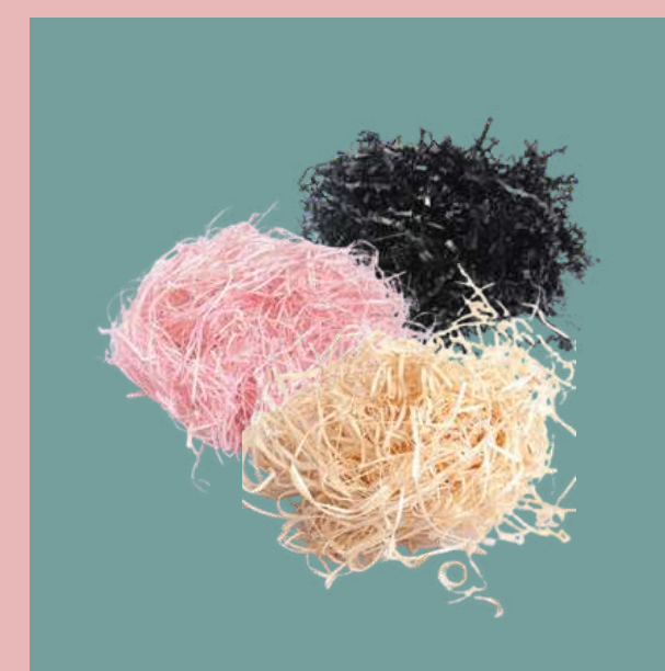
Dopasowane wypełnienie pudełka